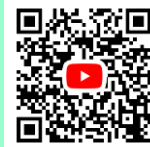
●令和5年9月14日 連合審査会録画映像