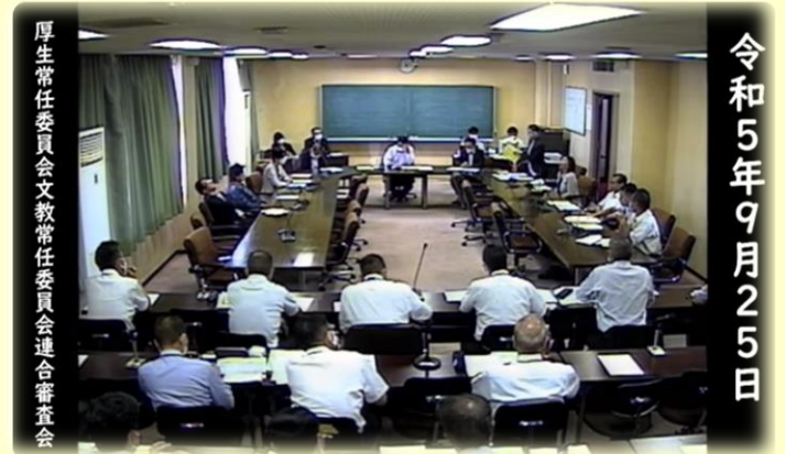
●YouTube 橿原市議会公式チャンネルより

私は民間と提携して、時間の空白なく、 橿原市に住まう子どもたちを守る体制を整えるべき ではないかと考えます。