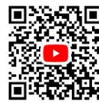
●令和5年9月25日 連合審査会録画映像